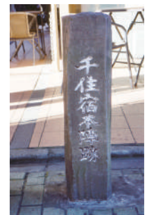
千住宿本陣跡石碑 (千住三丁目33)