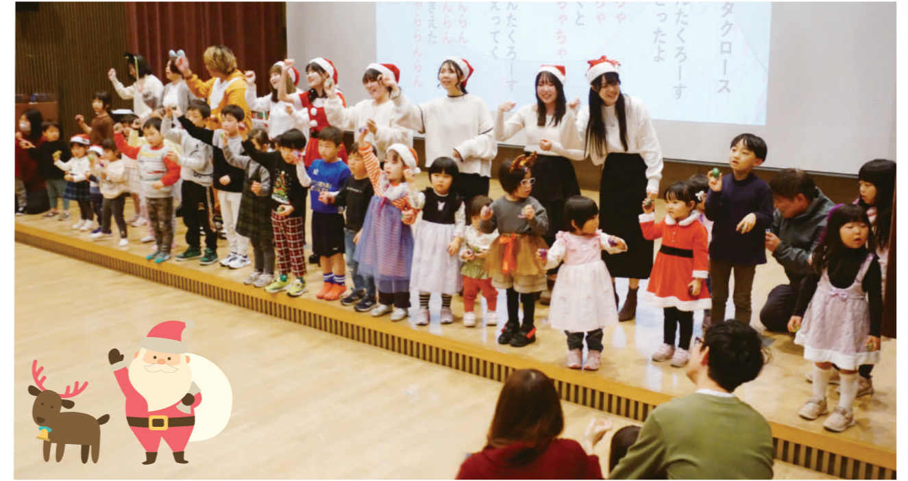
子どもたちはエッグマラカスを手に「あわてんぼうのサンタクロース」を演奏