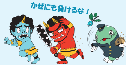
豆まきするナマガくん(生涯学習センターキャラクター)

【日時】2/26(水) ①午前10時～ ②午後4時～ ③午後7時～ 【対象】どなたでも(午後7時は16歳以上) 【定員】各15人程度 【料金】無料 【場所】研修室5