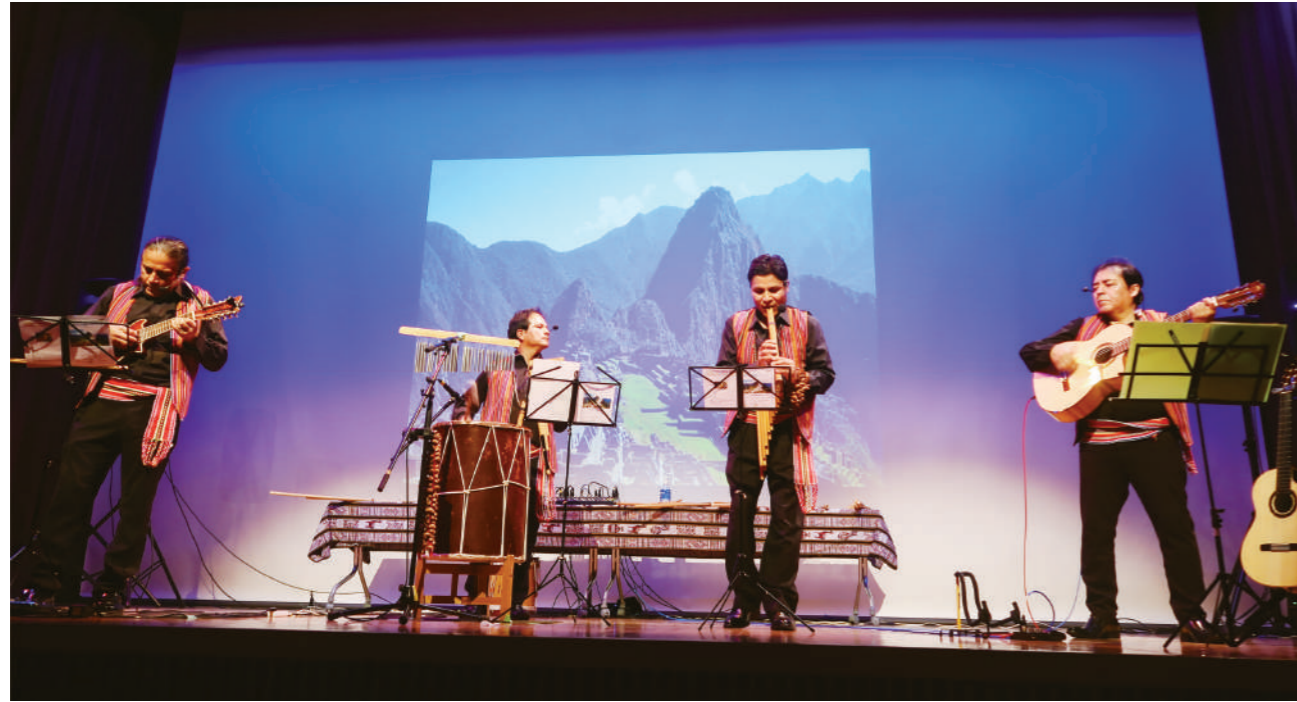
マチュピチュの画像をバックに「コンドルは飛んでいく」の演奏