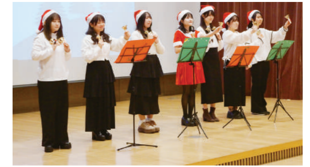
学生によるミュージックベルの演奏で「きよしこのよる」