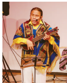
ハビエル (チャランゴ、ケーナほか)