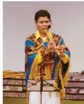
ウィリアム (ケーナ、サンポーニャほか)