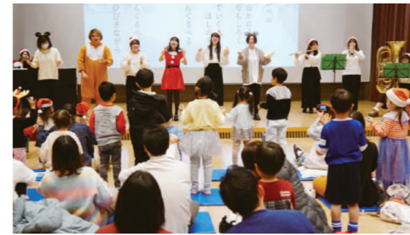
フルート、トランペット、チューバなどの楽器も加わり「ジングルベル」