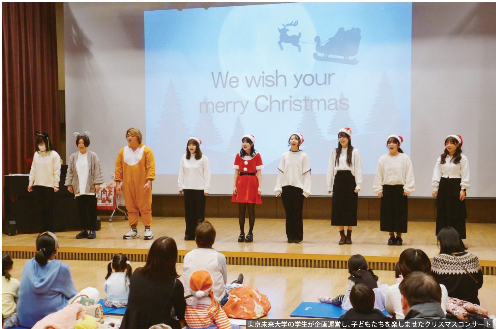
東京未来大学の学生が企画運営し、子どもたちを楽しませたクリスマスコンサート