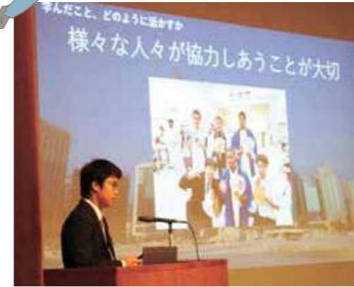
都立足立工科高等学校 「UAE派遣研修会の成果について」