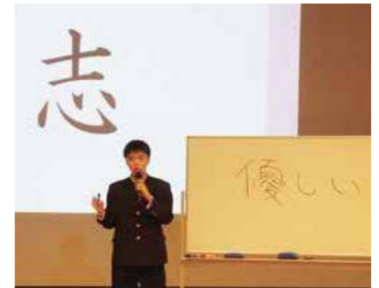
足立学園高等学校 「僕達の志」