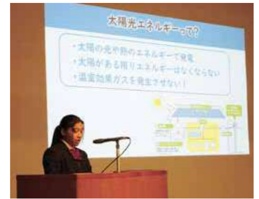
都立足立新田高等学校 「足立区の地域活動について」