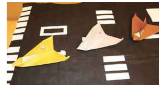
1位から3位の賞品は金、銀、銅の立体折り紙ヒコーキ