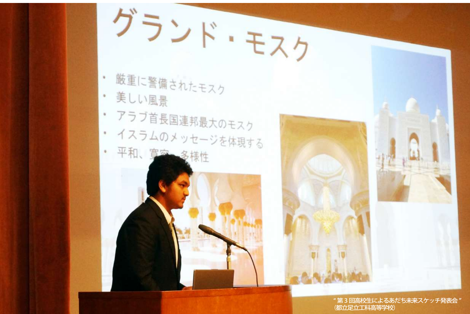
“第3回高校生によるあだち未来スケッチ発表会” (都立足立工科高等学校)