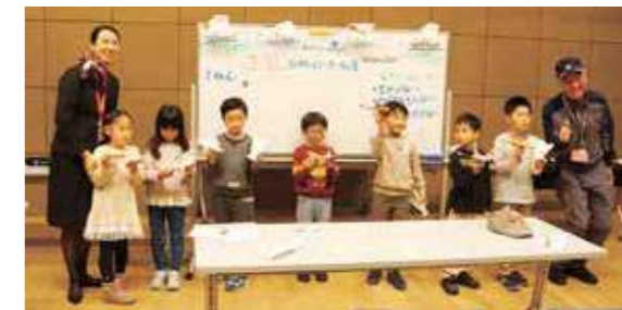
競技会上位7名が表彰を受けました。