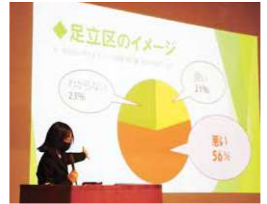
潤徳女子高等学校 「“北千住”を考える」