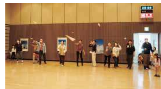
大人も童心に帰って折り紙ヒコーキを飛ばしました。