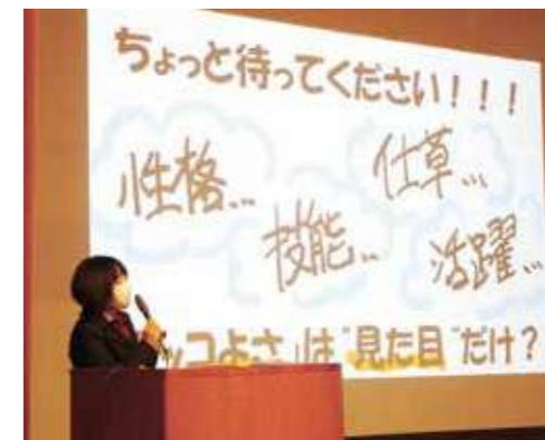
潤徳女子高等学校 「かっこいいキャラクターとは」