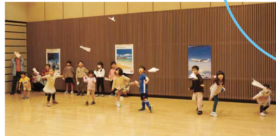
折り紙ヒコーキ競技会