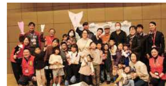
最後は全員で記念撮影