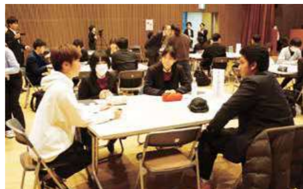
第3部:一般参加者や大学生も交えての意見交流会

1校ごとに設けた質疑応答の時間では、高校生や来場者からの多くの質問に発表者と会場が一体となった温かみのある交流タイムになりました。参加した高校生からは「自分の発表は最後までやり通すことができた」「このような場を更に沢山経験して視野を広げたい」「他校の皆さんの発表を聞く機会に恵まれたこと、大変貴重な体験をさせていただいた」といった声が寄せられました。