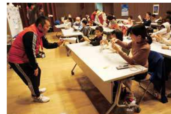
指導員が折り方を指導

「JAL折り紙ヒコーキ教室」が3分野連携事業“ちょいカル”として講堂で開催されました。8名のJAL指導員と13組の親子が参加。今回の折り紙ヒコーキはその姿から“イカヒコーキ”。指導員が各机を回って分かりやすく折り方を指導。折りあがったヒコーキを大人も交え全員で試験飛行しました。12メートル先の壁までまっすぐ飛んでいくヒコーキも……。その後、行われた子ども競技会の賞品は金、銀、銅などの立体折り紙ヒコーキ。受賞者は目を輝かせていました。子どもから大人まで大満足の日でした。