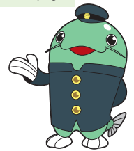
足立区生涯学習センター 公式キャラクター「ナマガंकun」