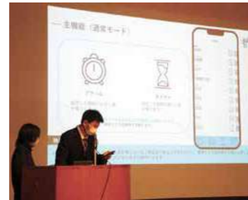
都立小台橋高等学校 「高校生ハッカソン(プログラミングイベント)でトップ7に入りました!」