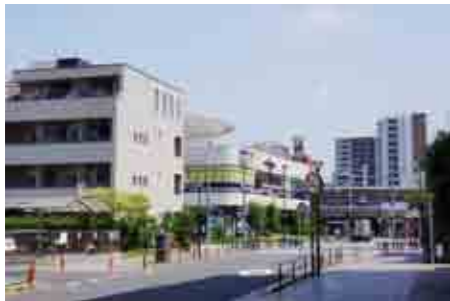
新しいまちづくりが進んでいる京成千住大橋駅周辺