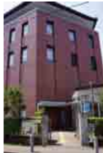
石洞美術館入り口