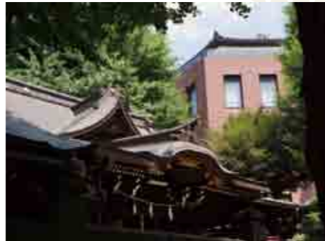
橋戸稲荷の千鳥破風、唐破風屋根の向こうは現代建築