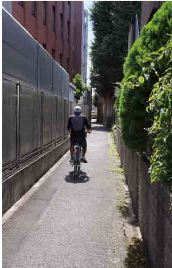
橋戸稲荷と石洞美術館が入る千住金属工業(株)に挟まれた路地